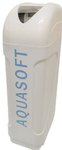
AQUASOFT Budget H10 bis H25