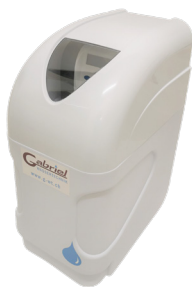
AQUASOFT Budget H12